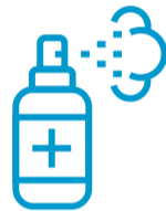
Desinfektion von Kontaktflächen