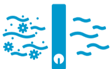
Virenbekämpfung in der Raumluft durch HEPA-Raumluftfilter