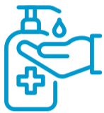
Handdesinfektion direkt am Eingang