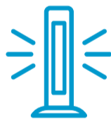
Desinfektion von Brillenfassungen durch UV-C Licht